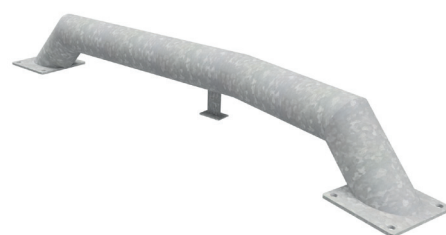
Naprowadzacz AMTR-N ŁAMANY

Naprowadzacz stalowy AMTR-N PROSTY ma długość 1840 mm. Rama stanowiąca jego szkielet i stopy wykonane są z okrągłych profili stalowych o średnicy 159 mm. Całość przytwierdzona jest do podstaw kwadratowych wykonanych z blachy płaskiej.