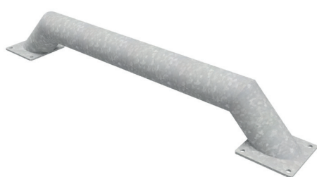
Naprowadzacz AMTR-N PROSTY

Naprowadzacz stalowy AMTR-N PROSTY ma długość 1840 mm. Rama stanowiąca jego szkielet i stopy wykonane są z okrągłych profili stalowych o średnicy 159 mm. Całość przytwierdzona jest do podstaw kwadratowych wykonanych z blachy płaskiej.